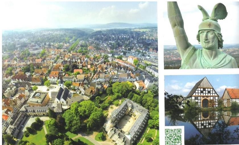
Detmold – Kulturstadt im Teutoburger Wald