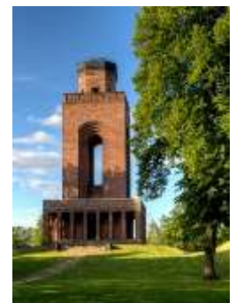
Bismarckturm eröffnet 1917