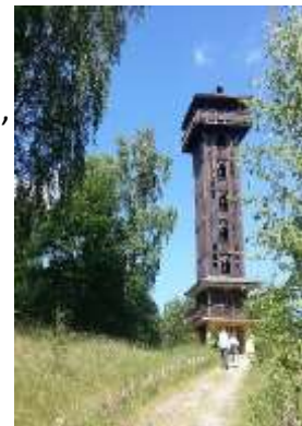
Turm auf dem Wehlaberg

Wanderung im Bergspreewald, Krausnicker Berge, Wehlaberg mit Turm, (höchster Berg im Spreewald 144 Meter) Schwanensee, Mittelsee, Pichersee, Köthener See, Groß Wasserburg