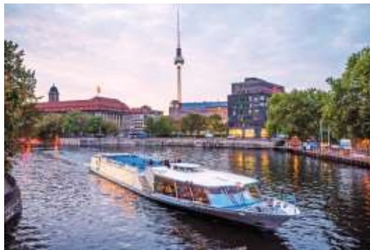
Stern und Kreisschiffahrt Berlin

18.00 Uhr Friedrichstr. Anlegestelle Schiff