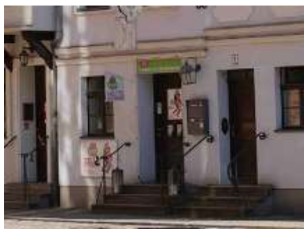
Eingang Theater im Nikolaiviertel