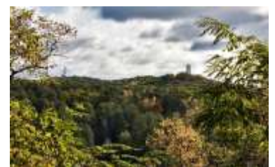
Blick zum Müggelturm

Nachmittags: Führung Altstadt Koepenick und Schloss