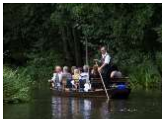
Fährmann mit Kahn

18.30/19.00 Uhr Rückfahrt nach Köpenick zum Hotel.