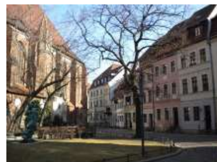
Nikolaiviertel links die Nikolaikirche