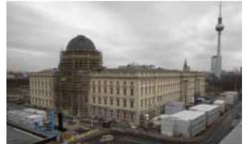
Stadtschloss (Neubau)

18.00 Uhr Friedrichstr. Anlegestelle Schiff