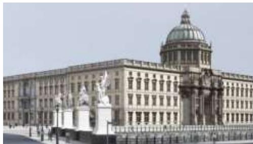
Berliner Stadtschloss historisch