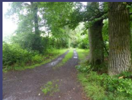
Ein Waldweg im Nettetal