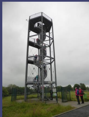
Aussichtsturm in Bad Marienberg