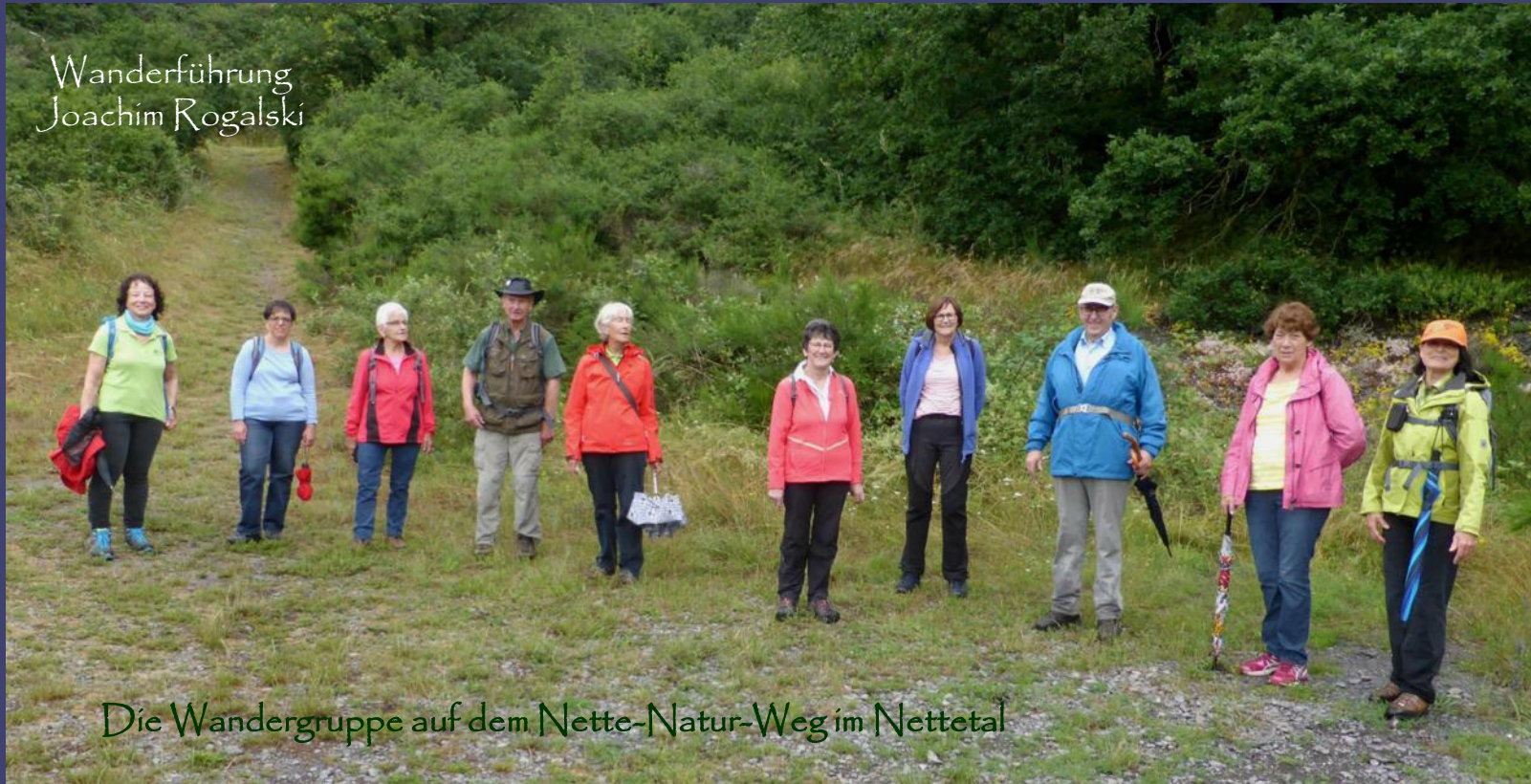
Die Wandergruppe auf dem Nette-Natur-Weg im Nettetal